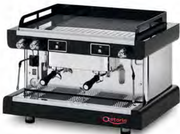
AEP STANDARD VERSION